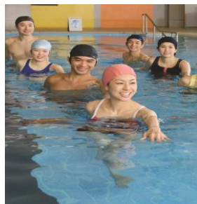
水中ウォーキング