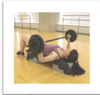
復活! ボディパンプ45 ～世界最速のシェイプアップ～